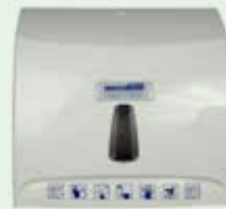
Distributeur mural de chiffons en microfibres sur rouleau