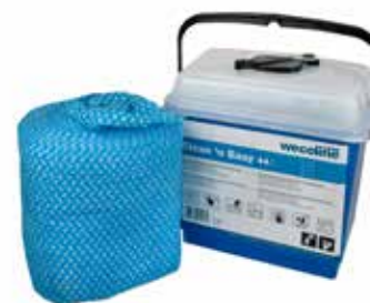
Seau distributeur avec chiffon prêt à l'emploi sur rouleau pour l'intérieur

Ce produit est prêt à l'emploi. Dans les zones où l'hygiène est importante, l'usage unique est la solution idéale pour un nettoyage rapide et efficace.