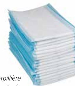
Serpillère non tissée, recharge

Le fonctionnement de notre concept Wecoline Clean 'n Easy Superior Single Use est super EASY :