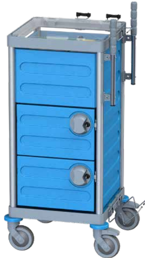
Chariot d'entretien Compact

Même en cas de catastrophe, il est recommandé d'avoir toutes les ressources et tous les matériaux à portée de main. Les chariots d'entretien sont disponibles dans différentes tailles. Vous pouvez les assembler de façon modulaire pour qu'ils conviennent à n'importe quel objet. Un chariot idéal pour tout professionnel de l'entretien. Les chariots d'entretien sont très caractéristiques car ils sont fermés sur le pourtour. Les matériaux usagés et les déchets restent ainsi hors de vue.