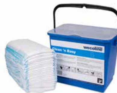
Serpillère non tissée dans un seau