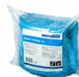
Recharge pour l'intérieur